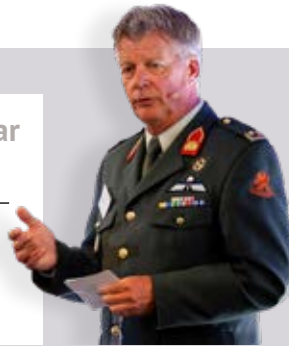
Brigadegeneraal b.d. Kees de Rijke

Datum: 8 februari Locatie: Cunerakerk, Kerkplein 1, Rhenen Aanvangstijd: 11.00 uur